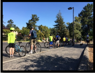
Socially Distant Middle School Bike Skills Workshop